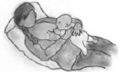
Acostada o reclinada