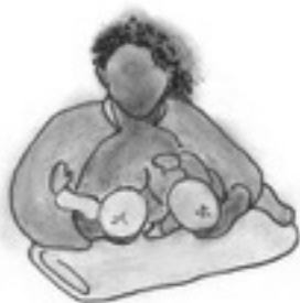
Balón de rugby doble con gemelos