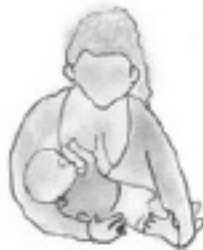
Posición de cuna