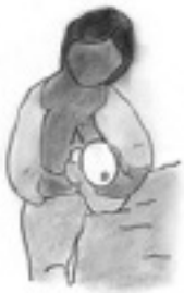
Posición de balón de rugby