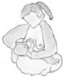
Posición de cuna cruzada

Estas son algunas de las posiciones que podría encontrar cómodas; siéntase libre de probar una o todas de ellas: