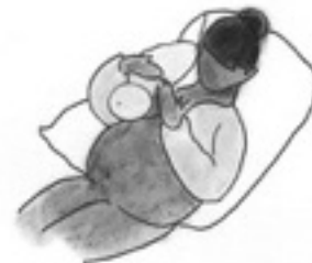
Sobre el hombro tras cesárea