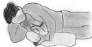
Posición acostada de lado